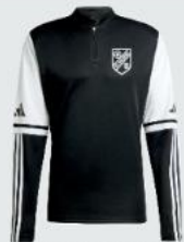
Junior 33 € / Senior 37 € Trainings Zip Top JE2748 / JE2767