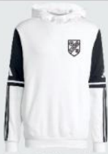
Junior 45 € / Senior 48 € Hoodie Sweat JE967 / JE970