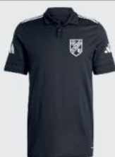
Junior 23 € / Senior 26 € Polo Shirt JE9415 / JE9417