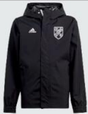
Junior 44 € / Senior 47 € Regenjacke JE4014 / JE4010