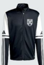
Junior 33 € / Senior 37 € Trainingsjacke JE2774 / JE2766