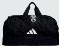
Small 32 € / Medium 37 € / Large 40 € Teambag JE9743 / JE9742 / JE9744

Small 48x27x20cm Medium 50x30x29cm Large 65x32x31cm