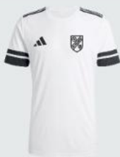
Junior 19 € / Senior 21 € Trainings Shirt JE957 / JE955