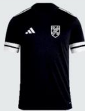
Junior 19 € / Senior 21 € Trainings Shirt JE952 / JE952