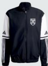
Junior 37 € / Senior 40 € Präsentationsjacke mit RV JE2770 / JE2761