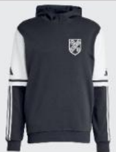
Junior 45 € / Senior 48 € Hoodie Sweat JE2748 / JE2776