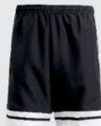
Junior 18 € / Senior 21 € Downtime Short mit RV JE2772 / JE9274