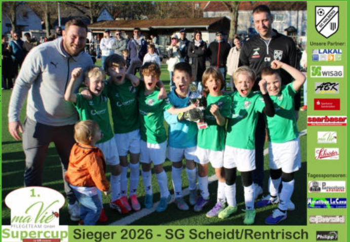
Sieger 2026 - SG Scheidt/Rentrisch

Fazit: Ein tolles Tagesturnier bei herrlichem Wetter – und schon jetzt ruft die Wärme des Erfolgs nach einer Neuauflage im Jahr 2027. Ein herzliches Dankeschön geht an alle Helfer, Sponsoren, sowie an die teilnehmenden Mannschaften, Betreuer und Trainer. Ohne euch wäre dieser Tag nicht so geschmackvoll gelungen – wie eine legendäre Nachmittags-Sause, nur sportlich.