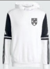
Junior 45 € / Senior 48 € Hoody Sweat J18487 / J18276