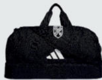
Small 32 € / Medium 37 € / Large 48 € Teambag J189743 / J189742 / J189744

Small 48x27x20cm Medium 58x30x29cm Large 65x32x27cm