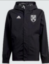
Junior 44 € / Senior 47 € Regenjacke J14314 / J14310