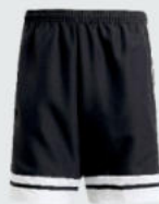
Junior 18 € / Senior 21 € Downtime Short mit RV J12772 / J18274