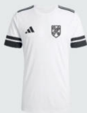
Junior 18 € / Senior 21 € Trainings Shirt J18957 / J18935