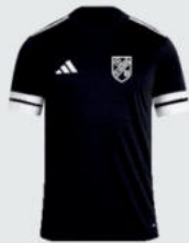
Junior 18 € / Senior 21 € Trainings Shirt J18952 / J18932