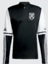
Junior 33 € / Senior 37 € Trainings Zip Top J12748 / J12767