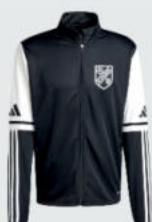
Junior 33 € / Senior 37 € Trainingsjacke J12774 / J12766