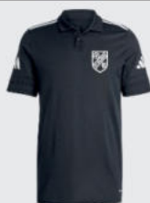
Junior 23 € / Senior 28 € Polo Shirt J19415 / J19417