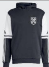
Junior 45 € / Senior 48 € Hoody Sweat J12768 / J12776