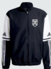
Junior 37 € / Senior 48 € Präsentationsjacke mit RV J12776 / J12761